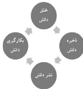
شکل ۱. فرایند مدیریت دانش بر اساس مدل هیسینگ

بسیاری از مسایل تصمیم‌گیری را نمی‌توان در یک ساختار سلسله‌مراتبی جای داد و این به دلیل تعاملات بین عوامل مختلف است که بعضاً عوامل سطح بالا وابستگی خاصی به عوامل سطح پایین دارند (Dagdeviren, Yuksel and Kurt, 2008). فرآیند تحلیل شبکه‌ای (ANP) یکی از کارآمدترین روش‌ها برای تصمیم‌گیری با معیارهای چندگانه است که برای اولین بار توسط توماس ال. ساعتی ۱ در سال ۱۹۸۲ و به عنوان حالت توسعه یافته روش AHP مطرح شد. این تکنیک، فرآیند تحلیل سلسله‌مراتبی (AHP) را به عنوان یک ابزار تصمیم‌گیری چند معیاره به وسیله جایگزینی شبکه به جای سلسله‌مراتب بهبود می‌بخشد. ساعتی پیشنهاد کرد که از روش AHP برای حل مسایلی در حالت استقلال بین گزینه‌ها و معیارها استفاده شود و از روش ANP نیز برای حل مسایلی که وابستگی بین گزینه‌ها یا معیارها وجود دارد، استفاده شود. فرایند تجزیه و تحلیل شبکه‌ای می‌تواند به عنوان ابزاری سودمند و البته واقعی‌تر در مقایسه با فرآیند تجزیه و تحلیل سلسله‌مراتبی در مسایلی که تعامل بین عناصر سیستم تشکیل ساختار شبکه‌ای می‌دهد به کار