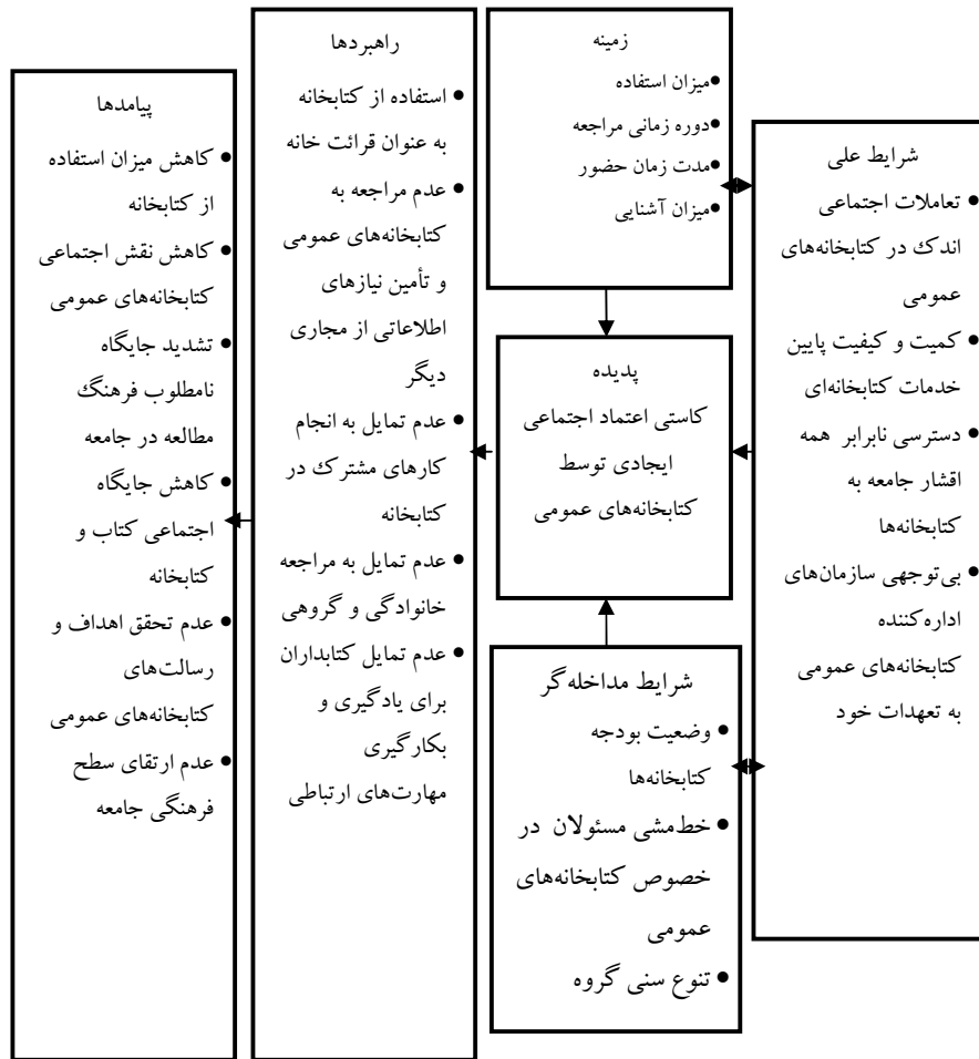
شکل ۲. مدل پارادایمی پدیده کاستی اعتماد اجتماعی ایجاد شده توسط کتابخانه‌های عمومی

شرایط علی: یکی از عوامل ایجاد اعتماد اجتماعی، تعامل‌های اجتماعی در محیط کتابخانه‌هاست. در مشاهده‌های انجام‌شده در محیط کتابخانه‌ها و بررسی فعالیت‌های داوطلبانه در آن‌ها، مشخص شد که مشارکت اعضا در این امور چندان قابل ملاحظه نیست، یکی از علل کم بودن این تعامل‌ها، کمبود امکان بحث و گفتگو در فضای داخل و محوطه کتابخانه‌هاست که با برنامه‌ریزی مناسب می‌توان فضاهای مورد اشاره را تدارک دید.