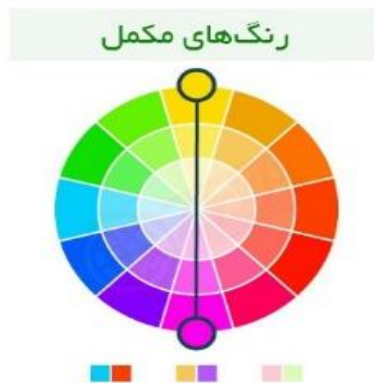
شکل ۳. رنگ‌های مکمل مورد استفاده در وبسایت‌های آموزشی