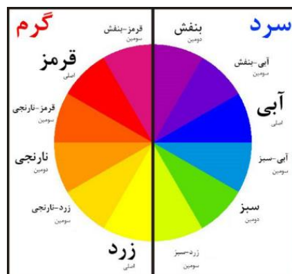
شکل ۲. کنتراست رنگ‌های سرد و گرم در وبسایت‌های آموزشی

یکی از راه‌های استفاده از رنگ در وبسایت‌های آموزشی، استفاده از کنتراست سرد و گرم (شکل ۲) است. کنتراست سرد و گرم به تضاد بین رنگ‌های سرد و گرم گفته می‌شود. رنگ‌های سرد شامل آبی، سبز و بنفش هستند که احساس آرامش و صلح را در افراد و رنگ‌های گرم شامل قرمز، نارنجی و زرد هستند که احساس هیجان و انرژی را در افراد ایجاد می‌کنند.