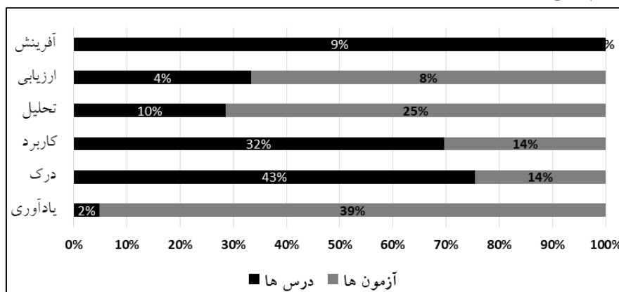
نمودار ۲. مقایسه وضعیت شناختی درس های کارشناسی ارشد و آزمون دکترا

آنها برای ورود به مقطع بالاتر به مهارت های سطح بالا توجه داشته باشد. نکته دیگر اینکه به رغم نیاز فراگیران در این مقطع از بین مهارت های شش گانه شناختی بر مهارت درک، بیش از سایر مهارت ها تأکید شده است (۴۳ درصد) و حتی آزمون ها بر مهارتی سطح پایین تر یعنی یادآوری تأکید دارند (۳۹ درصد). می توان استدلال کرد چنانچه آموزش های این افراد منطبق با هدف های رفتاری در سرفصل ها باشد، انتظار از دانش آموختگان این مقطع برای تحلیل، ارزیابی و خلق ایده و دانش امری دور از واقعیت خواهد بود. نمودار ۲ وضعیت شناختی درس های کارشناسی ارشد و آزمون های دکترا را نشان می دهد و بر پایه آن می توان به پرسش سوم پاسخ داد.