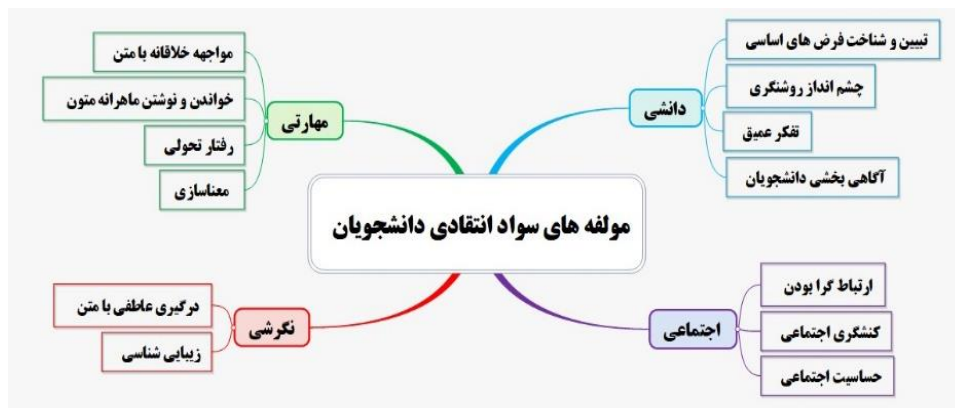
شکل ۱. مؤلفه‌های سواد انتقادی دانشجویان

از مؤلفه دانشی رسالت آگاهی‌بخش سواد انتقادی (شامل مفاهیم، پیش‌فرض‌ها، آرمان‌های سواد انتقادی)، مؤلفه مهارتی بیانگر تلفیق دانش و نگرش دانشجویان به‌منظور کسب یک توانایی سواد انتقادی، مؤلفه اجتماعی هسته بنیادی سواد انتقادی است که در آن دانشجو دائماً از خود جدا شده و زندگی در زیستگاه اجتماعی و حل معضلات اجتماعی دیگران را یک وظیفه انسانی و اجتماعی در خود می‌داند. مؤلفه نگرشی نیز جهت‌دهنده سایر مؤلفه‌های سواد انتقادی است.