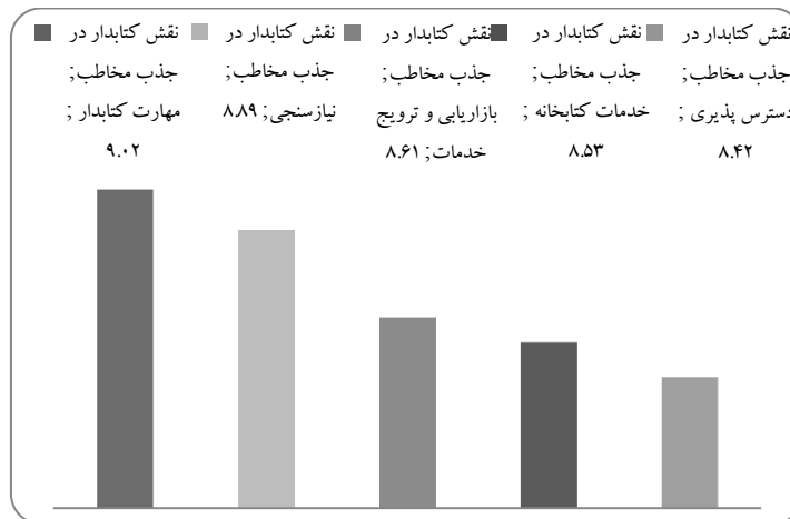
تصویر ۲. نقش مؤلفه‌های فرعی با محوریت کتابدار در جذب مخاطب

در بین مؤلفه‌های مربوط به نقش کتابدار در جذب مخاطب، نیازسنجی و مهارت کتابدار در جذب مخاطب از بقیه مؤلفه‌های فرعی میانگین بیشتری کسب کرده و امتیاز بالاتر از میانگین (۸/۶۹) به دست آورده است و از دید گروه متخصصان تأثیر بیشتری در جذب مخاطب دارند.