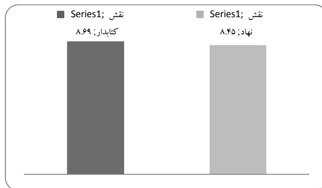
تصویر ۴. مقایسه نقش نهاد و نقش کتابدار در جذب مخاطب

در بین مؤلفه های مربوط به نقش نهاد کتابخانه های عمومی کشور در جذب مخاطب طراحی فضای داخلی کتابخانه، مکان کتابخانه، تجهیزات کتابخانه، کارآفرینی سازمانی از دید گروه متخصصان امتیاز بالاتر از میانگین به دست آورده (۸/۴۵) و از دید متخصصان تأثیر بیشتری در جذب مخاطب دارند.