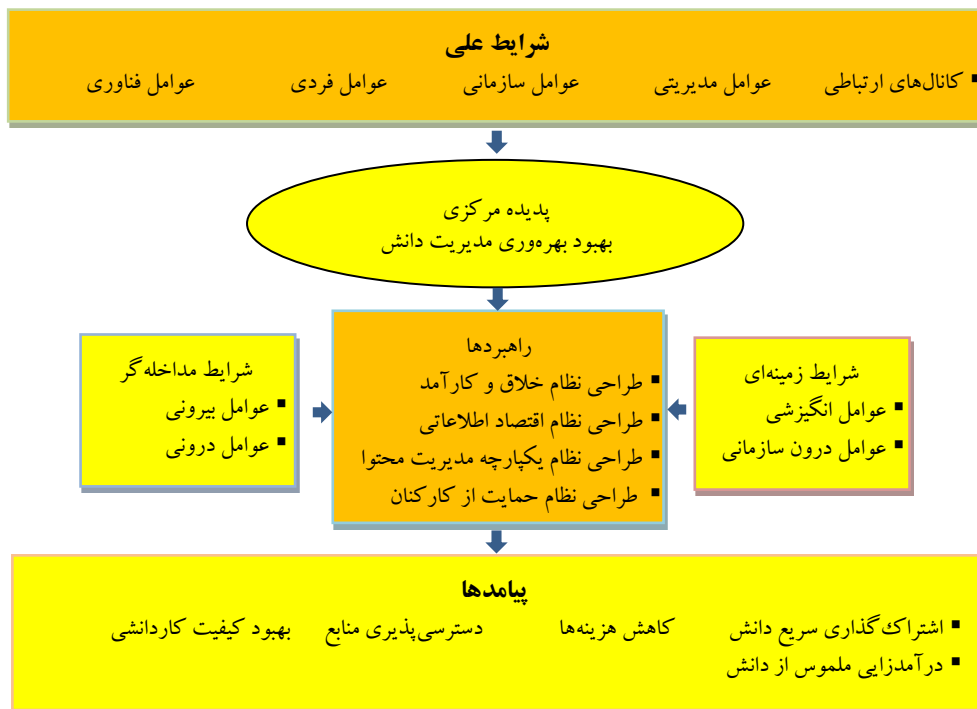
شکل ۲. کدگذاری محوری براساس پارادایم (مدل)

کدگذاری انتخابی مرحله اصلی نظریه‌پردازی است که براساس نتایج دو مرحله کدگذاری باز و کدگذاری محوری، به ارائه نظریه می‌پردازد. شرایط زمینه‌ای یا بستر مجموعه، شرایطی است که زمینه پدیده موردنظر را فراهم می‌سازد و بر رفتارها و کنش‌ها تأثیر می‌گذارد. در این پژوهش شرایط علی یا عوامل ایجادکننده شامل (کانال‌های ارتباطی، عوامل مدیریتی، عوامل سازمانی، عوامل فردی، عوامل فنی)، پدیده اصلی (بهبود بهره‌وری مدیریت دانش)، شرایط مداخله‌گر یا عوامل تسریع‌کننده یا کندکننده (عوامل بیرونی و عوامل درونی)، شرایط زمینه‌ای یا عوامل زمینه‌سازی (عوامل انگیزشی و عوامل درون‌سازمانی)، راهبردها یا راهکارهای توسعه‌دهنده (طراحی نظام خلاق و کارآمد، طراحی نظام اقتصاد اطلاعات، طراحی نظام یکپارچه مدیریت محتوا و طراحی نظام حمایت از کارکنان دانشی) و پیامدها یا نتایج حاصل از (اشتراک‌گذاری سریع دانش، کاهش هزینه‌ها، دسترسی پذیری منابع، بهبود کار کارکنان دانشی و درآمدزایی ملموس از دانش) به‌عنوان مقوله‌های مدل شناسایی شدند.